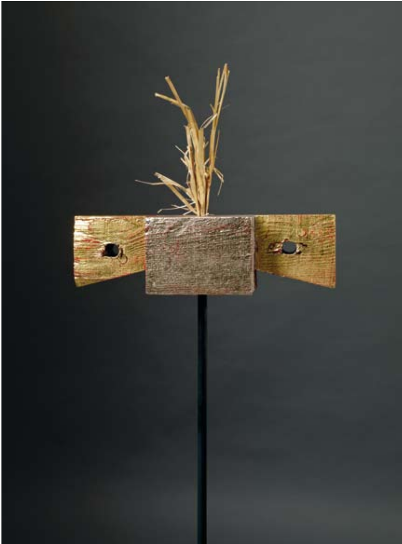
Kapital zwischen den Ohren Holz, Stroh, Blattgold 11,5 x 40,5 x 10,0 cm, 2011