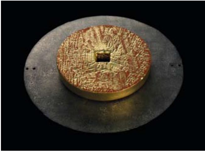
Sonnenscheibe Sandstein, Blattgold Durchmesser 40 cm, Metallplatte 68,5 cm, 2008