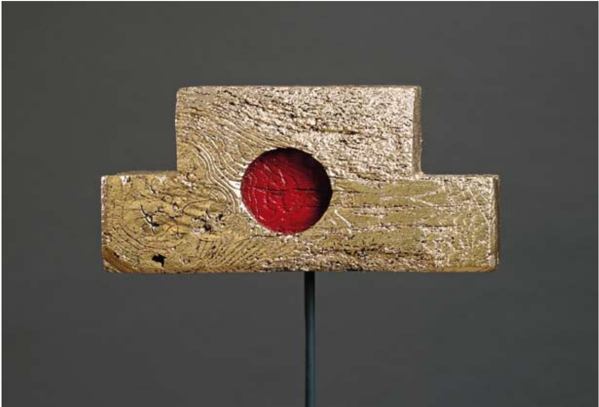
Querdenker Holz, Blattgold 25,5 x 52 x 18 cm, 2011