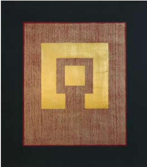
Haus – Zelle, rot Blattgold-Collage auf Multiplex 80 x 70 cm, 2006