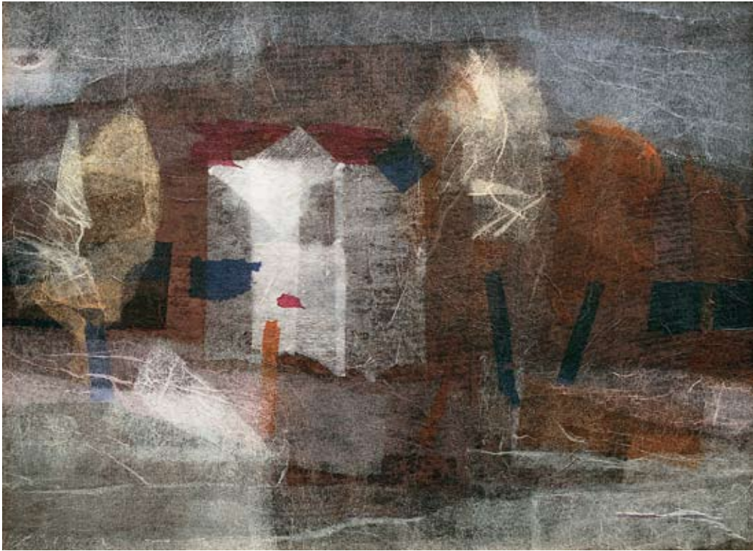
Bahnübergang Neue Häuser Collagemalerei 70,5 x 94,5 cm, 1987