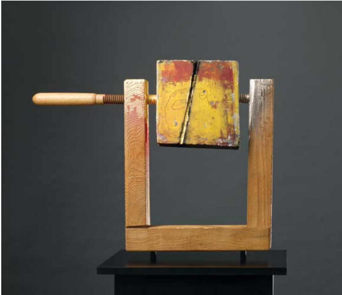
Entscheidung Holz, Druckstock, Farbfassung, Blattgold 57 x 71 x 7,5 cm, 2011