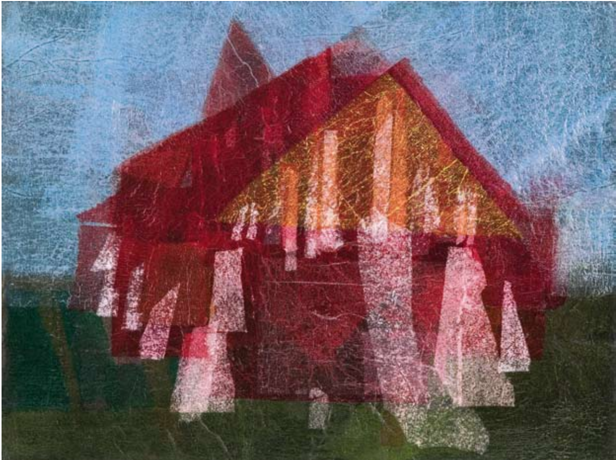
Kirche Bobbin 2 Collagemalerei 67 x 89,5 cm, 1996