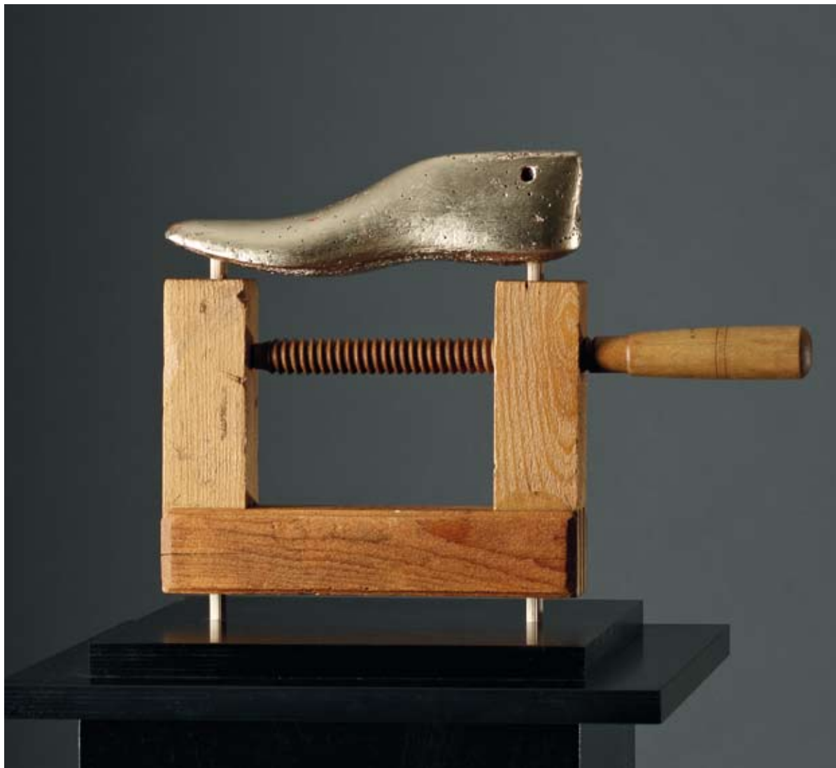
Schuster Holz, Blattgold 29 x 40 x 8 cm, 2011