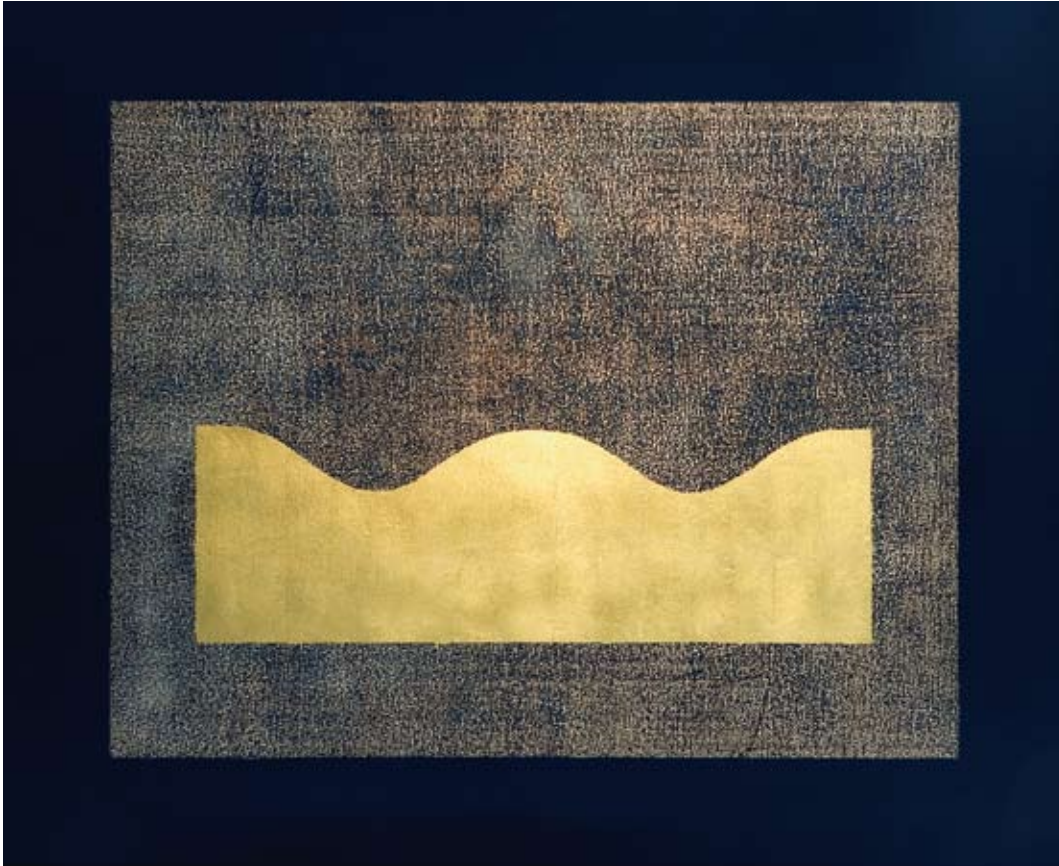
Fremdes Land Blattgold-Collage auf Multiplex 75 x 90,5 cm, 2006