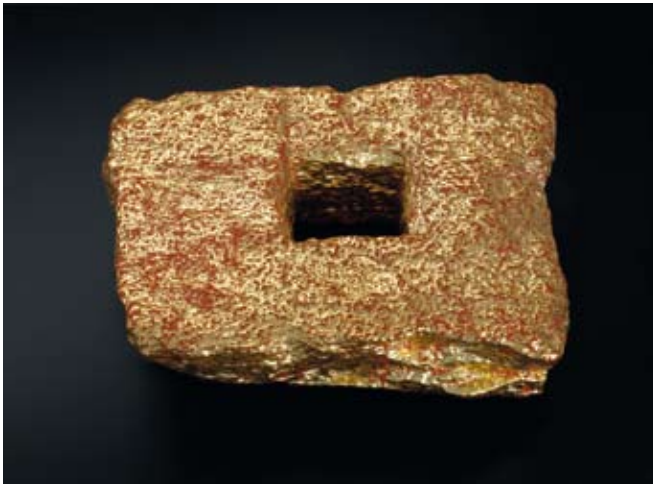
Haus Zelle Stein, Blattgold Stein 29 x 36 cm, Bildträger 60 x 60 cm, 2008