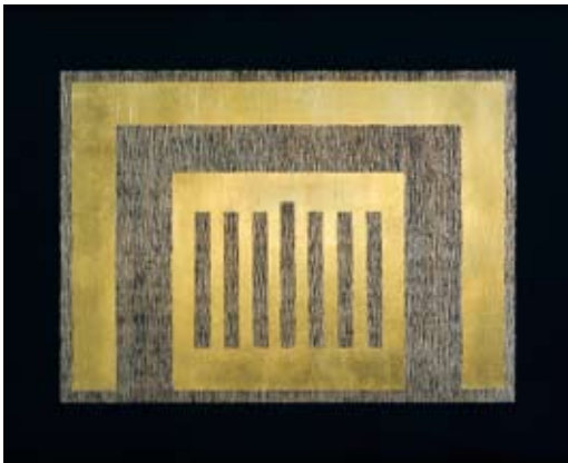
Menorah 2 Blattgold-Collage 57 x 71 cm, 2007